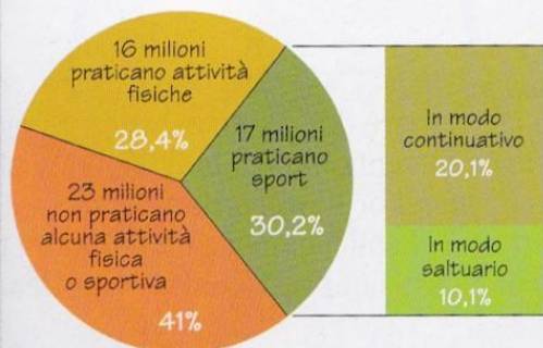
Grafico 4. La pratica sportiva in Italia. Anno 2006